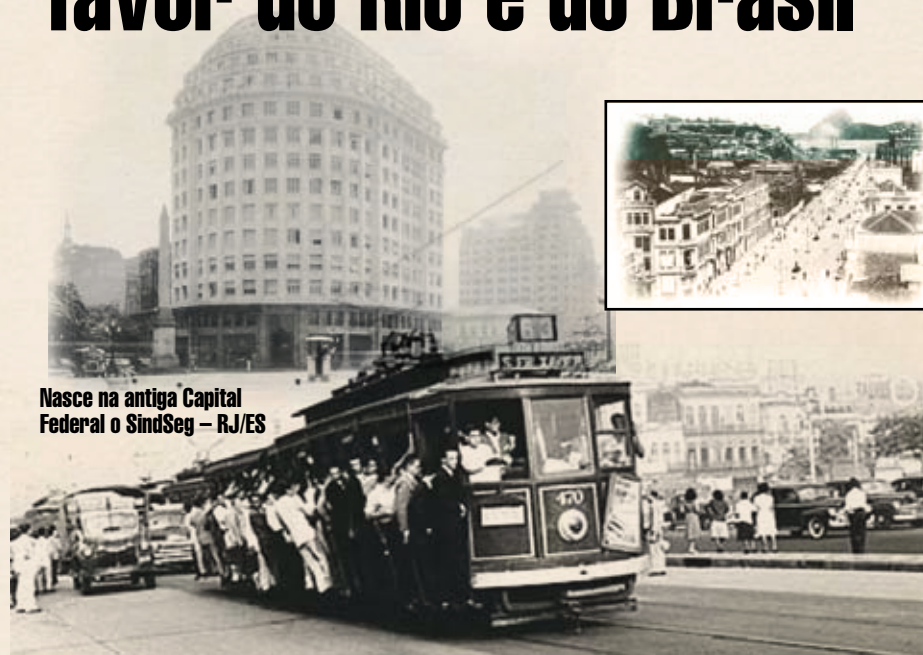
Nasce na antiga Capital Federal o SindSeg – RJ/ES

Força Aérea Brasileira, que acabava de ser criada.