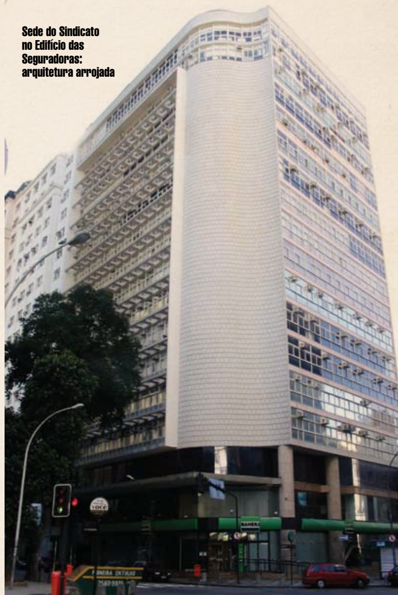
Sede do Sindicato no Edifício das Seguradoras: arquitetura arrojada

Circula pelos corredores do prédio a idéia de se constituir uma Federação dos Sindicatos das Empresas de Seguros Privados e de Capitalização, entidade destinada a coordenar e amparar os interesses das categorias econômicas já representadas por sindicatos regionais. A idéia, de imediato, agradou representantes dos sindicatos do Rio Grande do Sul e da Bahia. O Sindicato de Minas foi ainda mais longe: além de concordar com a idéia, já protocolou, junto ao Ministério do Trabalho, pedido de autorização para que se crie a nova entidade. Seguradores paulistas, igualmente favoráveis à idéia, apresentaram proposta de emendas aos projetos de Estatutos da Federação.