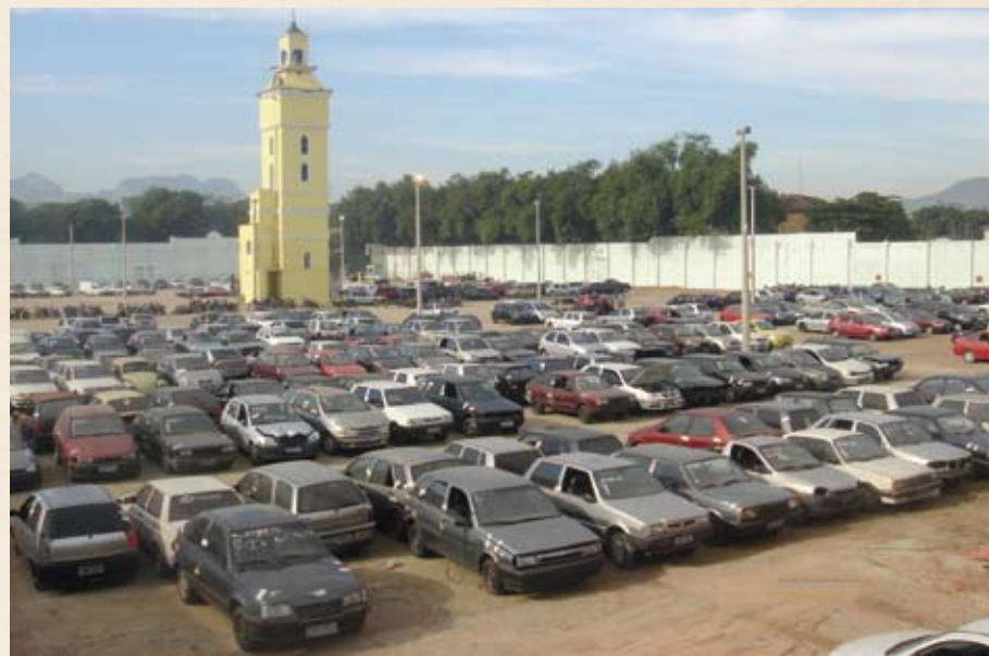
As instalações do Pátio Legal comportam 1.500 veículos